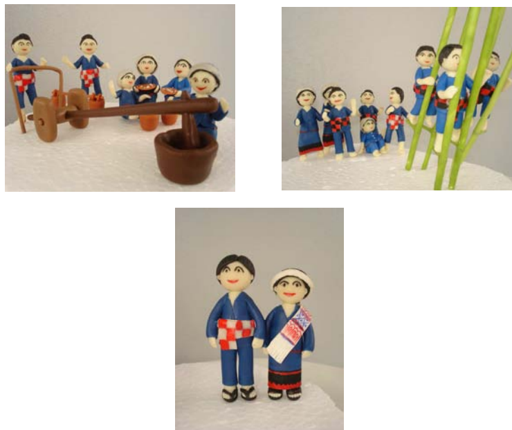
ภาพที่ 15-17 แสดงรูปแบบผลิตภัณฑ์ของที่ระลึก

การวิเคราะห์ข้อมูลความพึงพอใจที่มีต่อรูปแบบผลิตภัณฑ์ของที่ระลึก โดยใช้อัตลักษณ์เครื่องแต่งกาย ของชุมชนไทลื้อ บ้านหนองบัว อำเภอท่าวังผา จังหวัดน่านนั้น ได้ทำการประเมินความพึงพอใจจากกลุ่มตัวอย่าง