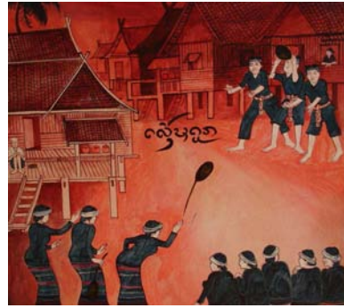
ภาพที่ 4-5 แสดงการเล่นของคนในชุมชน