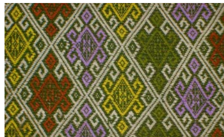
ภาพที่ 9-10 แสดงผ้าลายดอกจันทร์ 8 กลีบ และผ้าลายขอใหญ่