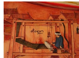
ภาพที่ 1-3 แสดงวิถีชีวิตของชาวไทลื้อ