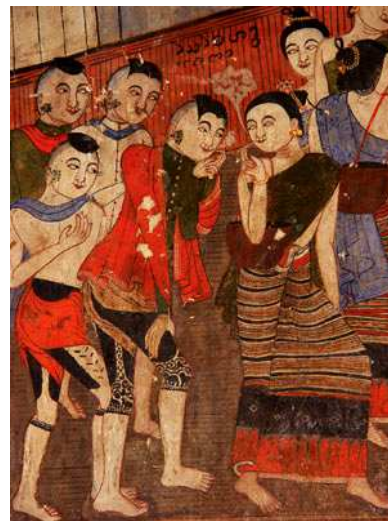
ภาพที่ 6-8 แสดงเครื่องแต่งกายแบบโบราณ

จากการศึกษาในส่วนของการศึกษาข้อมูลพื้นฐานของชุมชนไทลื้อ บ้านหนองบัว อำเภอน้ำขุ่น จังหวัดน่าน จากเอกสารเผยแพร่ข้อมูลของหมู่บ้านหนองบัว สามารถแบ่งออกเป็น 3 ด้าน คือ ด้านที่ 1 การดำเนินชีวิตของชาวไทลื้อแสดงภาพที่ 1-3 ด้านที่ 2 คือการเล่นของคนในชุมชนตามภาพที่ 4-5 และด้านที่ 3 คือการแต่งกายในอดีตของคนไทลื้อตามภาพที่ 6-8 โดยภาพดังกล่าวปรากฏอยู่ในวิหารวัดหนองบัว และบริเวณภายในวัด