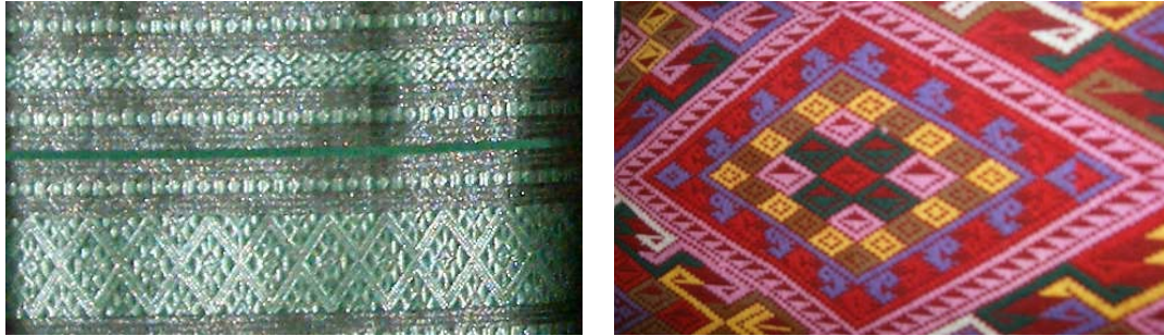
ภาพที่ 13-14 แสดงผ้าลายดอกกาบ และผ้าลายมุกหมัด ที่มา : จันทร์สมการทอง

3.2. ออกแบบของที่ระลึก โดยใช้อัตลักษณ์เครื่องแต่งกาย ของชุมชนไทลื้อ บ้านหนองบัว อำเภอท่าวังผา จังหวัดน่าน โดยการออกแบบของที่ระลึกใช้อัตลักษณ์เครื่องแต่งกาย ของชุมชนไทลื้อ บ้านหนองบัว อำเภอท่าวังผา จังหวัดน่านเป็นของที่ระลึกประเภทตุ๊กตาที่ใช้ดินปั้นให้มีรูปแบบที่แสดงวิถีชีวิต การละเล่น และการแต่งกายของไทลื้อ เป็นการถ่ายทอด ศิลปะวัฒนธรรม และขนบธรรมเนียมประเพณีของชนเผ่า ผู้วิจัยได้นำผ้าทอลายไทลื้อเป็นแนวทางในการออกแบบตามภาพที่ 15-17