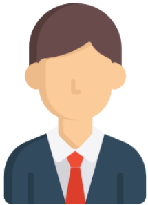
ผู้จ่ายเงิน